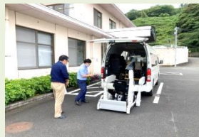
↑ 実際に、施設でハイエースとWHILLをご説明している様子。水俣店潮崎スタッフ。