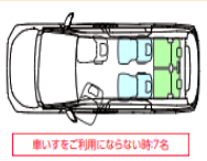
車いすご利用にならない時7名