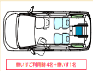
車いすご利用時4名+車いす1名

車いすの方お一人が「サード席」に乗車できるタイプです。車いすをご利用にならない時は標準車と同じシートレイアウトでご使用いただけます。また、助手席リフトアップチルトシートも標準装備になります。