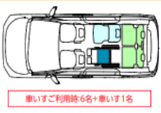
車いすご利用時6名+車いす1名

「セカンド席」と「サード席」にお一人ずつ乗車できる『車いす2名仕様』になります。 リクライニング機能付車いすや、電動車いす*、シニアカー*（*サード席位置）にも対応しております。